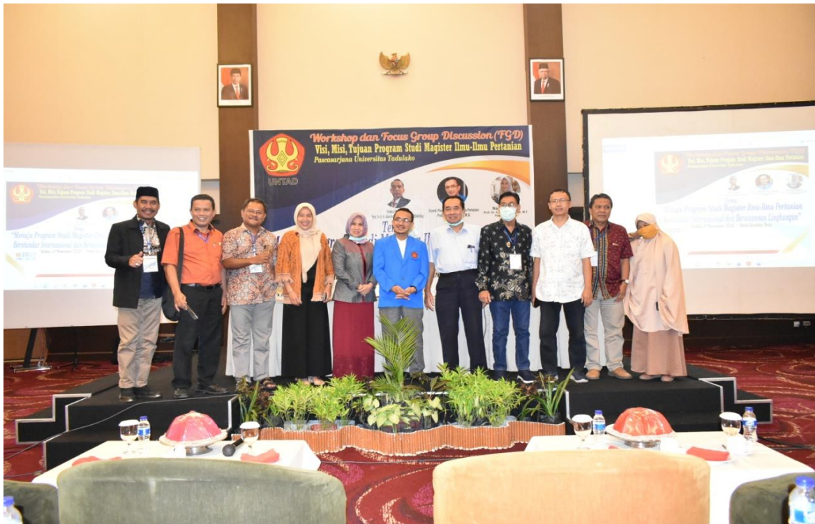
▪ Foto Bersama